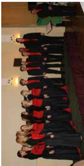
Weihnachtsrepertoire auf, sodass pünktlich zur Weihnachtszeit unsere neue Weihnachts-CD „Weihnachtsfreuden“ erscheinen konnte. Im November reisten wir wieder nach Tschechien, diesmal aber in die Hauptstadt Prag, um am 20. „International Festival of Advent and Christmas Music in Prag“ teilzunehmen. Wir durften unter anderem in der Salvatorkirche in Prag auftreten und konnten voller Freude ein Silbernes Diplom mit nach Hause bringen.

2010 nahmen wir zum 6. Mal am Chorfestival FAPS im tschechischen Svitavy teil, wobei wir erste Berührungen mit dem Oberbogensang hatten und die neu erworbenen Fähigkeiten bei einem großen Konzert gemeinsam mit über 200 Sängern und Sängerinnen darboten. Bei einem Benefizkonzert im Mai zu Gunsten krebskranker Kinder in der medizinischen Akademie in Magdeburg haben wir einen Teil des Programmes mitgestaltet. In diesem Jahr arbeiteten wir schon im Spätsommer akribisch unser