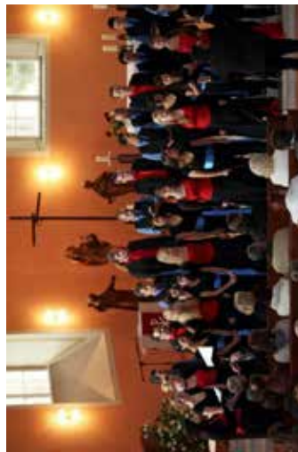
Im Mai gab es das 7. Festival „Sine musica nulla vita“. Im Juni hatten wir zwei Gemeinschaftskonzerte mit dem kolumbianischen Chor "Ensamble Vocal de Medellín" in Schönebeck und Magdeburg.

die USA gebracht haben und damit so einige fast vergessene Erinnerungen an die Heimat wieder erweckten. Ein schönes Gefühl.