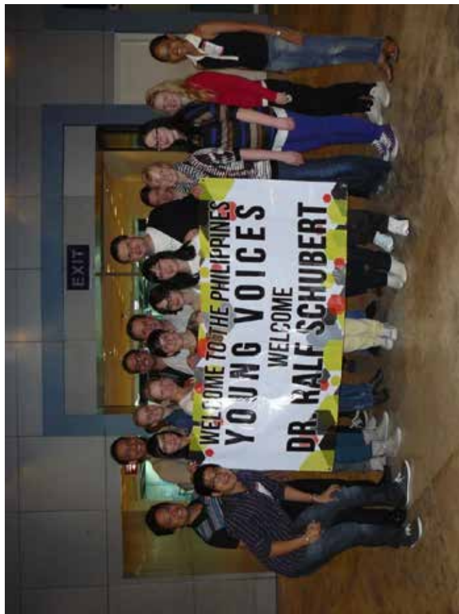
Typisch der herzliche Empfang (mitten in der Nacht) am Flughafen von Manila durch unsere Freunde. Wir haben viele neue Erfahrungen machen dürfen und bekamen Einblicke in eine wirklich sehr andere Kultur in einem fremden Land. Obwohl wir die meisten Leute vorher nicht kannten, sind wir mit einer beeindruckenden Gastfreundschaft aufgenommen worden.

Im März des Jahres 2013 gab es noch einmal einen ganz besonderen Höhepunkt: eine Chorreise nach Manila (Philippinen) – wir besuchten unseren Partnerchor die „Manila Chamber Singers“.