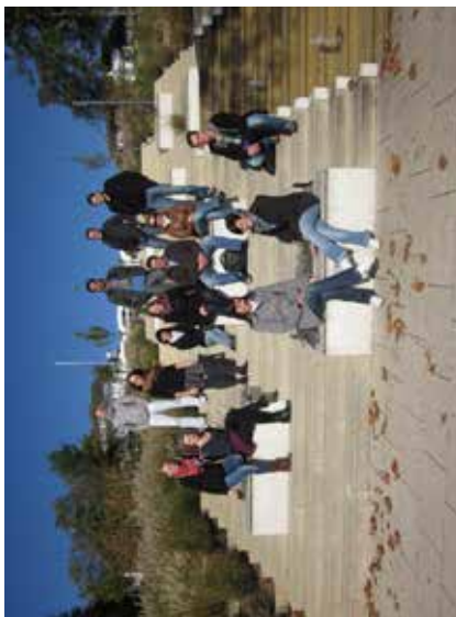
Im Jahr 2012 luden wir im März zunächst zu einem Frühlingkonzert, bei dem wir viele neue Stücke für unser Publikum im Gepäck hatten. Auch waren wir erneut in Tschechien, um am 7. internationalen Festival FAPS teilzunehmen. Dort gehören wir nun auch schon zu den „Urgesteinen“. Wie in jedem Jahr durften wir so einige Geburtstage und Hochzeiten musikalisch untermalen.